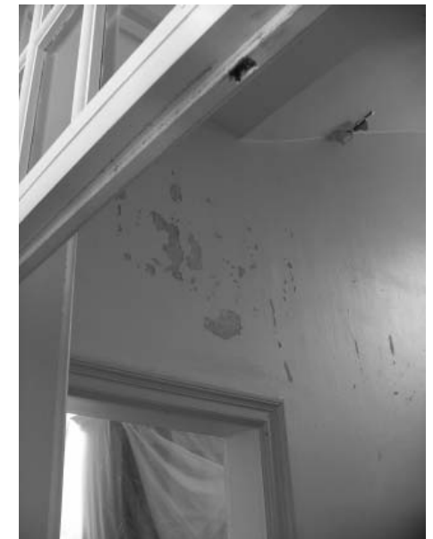
Peinture abimée des couleurs