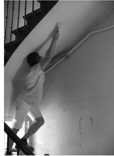
Grattage des vieilles peintures

Depuis quelques semaines nous vivons au rythme des artisans : électricité, peinture, tapisserie etc. Les travaux de réfection du presbytère se poursuivent afin de retrouver à la rentrée de septembre des lieux accueillants ! Venez voir le changement !