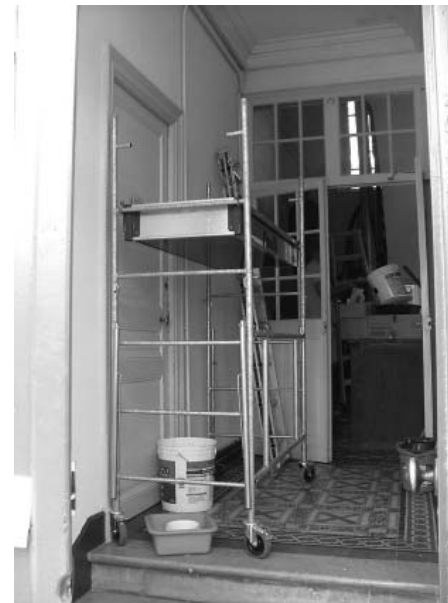
Echafaudage dans les couloirs