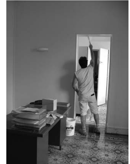
peinture de la salle d'accueil